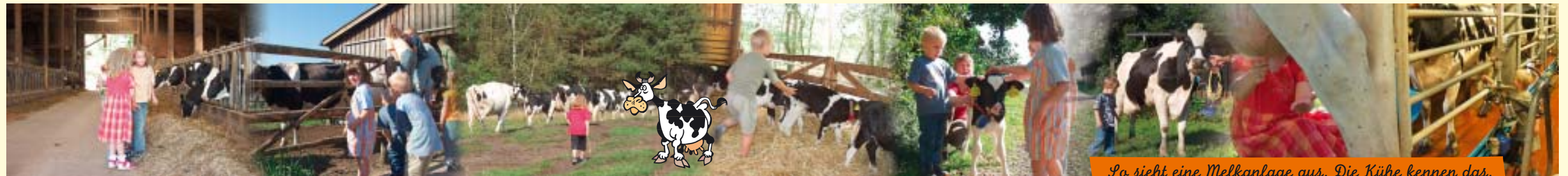
So sieht eine Melkanlage aus. Die Kühe kennen das.

...mal herauszufinden wie das alles mit der Milch funktioniert? Eine Kuh muss erst ein Kalb bekommen, bevor sie Milch geben kann. Möchtest Du eins streicheln? Weißt du wieviel Liter Milch eine Kuh am Tag gibt?