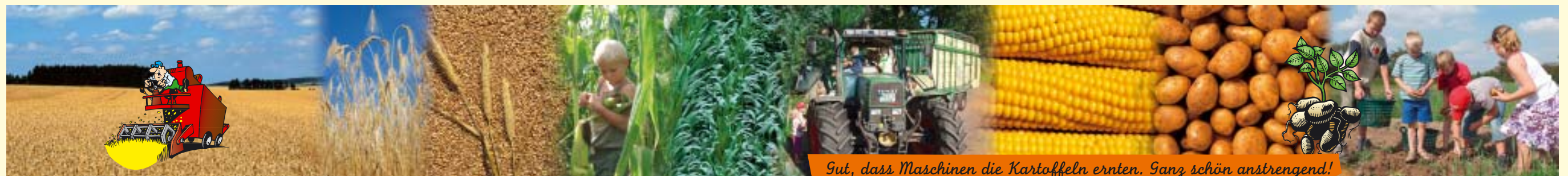
Gut, dass Maschinen die Kartoffeln ernten. Ganz schön anstrengend!

...mal herauszufinden wie das alles mit der Milch funktioniert? Eine Kuh muss erst ein Kalb bekommen, bevor sie Milch geben kann. Möchtest Du eins streicheln? Weißt du wieviel Liter Milch eine Kuh am Tag gibt?