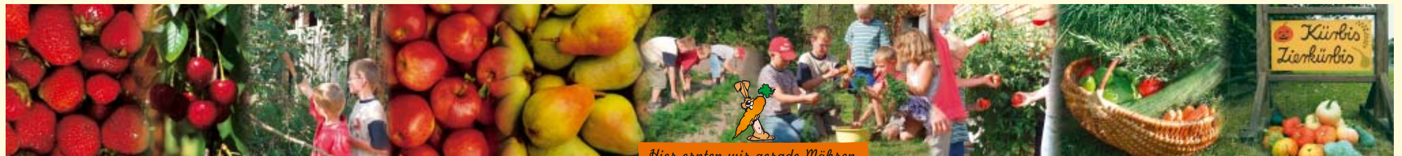
Hier ernten wir gerade Möhren.

... mal ein Kaninchen zu streicheln und im Hühnerstall Eier zu suchen? Es gibt über die Tiere auf dem Bauernhof eine Menge zu lernen. Möchtest Du wissen, wo diese Tiere leben und was sie zu fressen bekommen?