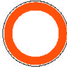
Verbot für Fahrzeuge aller Art

Es gilt nicht für Handfahrzeuge, abweichend von § 28 Abs. 2 auch nicht für Tiere. (...)